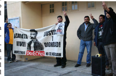
La V de Venceremos, muy en alto.