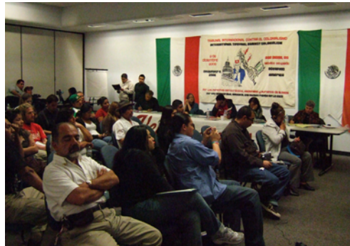
The audience listen to evidence against U.S. imperialism

International Human Rights day. It is in this way that our struggle has continued to work towards internationalizing and connecting