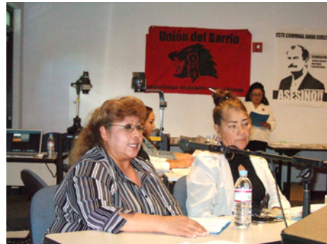
Mothers of prisoners, detained in U.S. Prisons speak of the torture and lack of medical attention

All the organizations that were present represented the different fronts of the same struggle for Dignity and Power. This tribunal was not just an "intellectual" and symbolic exercise, but a conscientious exercise for the building of an organization capable of bringing real accusations of violation of human and democratic rights to International forums to expose the vicious nature of our enemies. It is about creating the conditions