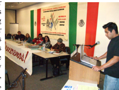
Organizations provided accusations and demonstrated crimes committed against Raza

On Saturday, December 9th, 2006, the Raza Rights Coalition organized a Tribunal Against Colonialism and for the struggle of Raza Self-Determination. The tribunal took place at San Diego City College in Downtown San Diego. With over 14 organizations participating and with over 30 organizations endorsing this tribunal, the Raza community of San Diego, Los Angeles, Oxnard and San Jose all came together for this historic tribunal.