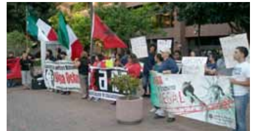
This is our land, this is our struggle! RRC takes our protest against SB1070 and migra terrorism to the Federal Building, July 2010

This September 15 the RRC will take on the duty to raise the banner of dignity and retake our destiny into our own hands; to organize our communities for its self-defense, to create that future that our sons and daughters will