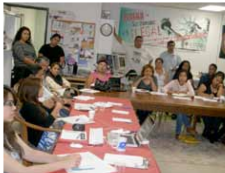
Los colectivos populares y organizaciones del pueblo se reúnen para hacerle frente unido contra la represión y por los derechos de nuestro pueblo. (Oficina del Comité de Amigos en San Diego)

donde acceso al cuidado médico sea garantizado sin distinción alguna o por falta de dinero, donde el derecho a leer y escribir sea universal, donde la vivienda sea accesible para todos y todas sin tener dos o tres familias bajo un solo techo,