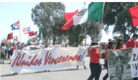
Los jóvenes se organizan y luchan en defensa del barrio

Y al llegar a la frontera nuestros hermanos enfrentan la posibilidad de la muerte al cruce, el abandono por parte de los guías, la posibilidad de detención por la migra, enfrentamiento con grupos racistas y vigilantes anglosajones dispuestos a matar. Para los que logran llegar al gran imperio, enfrentan la explotación en el trabajo, el desempleo o sub-empleo, la discriminación, el odio, redadas de la migra, retenes de policía, decomiso de vehículos, y la persecución en general, viviendo con la incertidumbre y las presiones de la vida diaria.