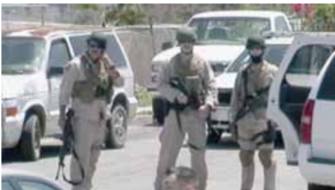
En Irak, Afganistán, Tamaulipas, y en Barrio Logan, EEUU en guerra contra los pobres. Redada de la migra (ICE y Patrulla Fronteriza) en Barrio Logan, abril 2010

Los gobiernos, al servicio de estas empresas, crean leyes y políticas como la SB1070 en Arizona, "Comunidades Seguras" que hacen de cada policía un agente de migración, "E-Verify" sistema de verificación de identidad para comprobar que una persona puede trabajar "legalmente" en Estados Unidos