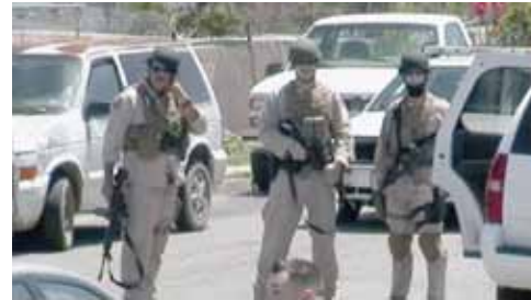
In Irak, Afganistán, Tamaulipas and Barrio Logan, the U.S. is waging war on the poor. ICE/Border Patrol raid in San Diego's Barrio Logan neighborhood in April 2010

< Bicentennial pg.6 kidnappings. We are threatened with deceit, bribery, confront the possibility of being murdered, and faced with legal and semi-legal problems. We become targets of delinquent bands, which in many instances are part of the repressive Mexican government (military/police).